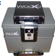
WooXo double disques