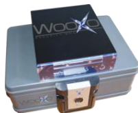
WooXo Security Box